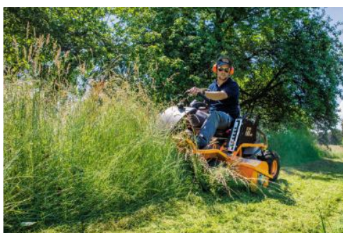
Illustration 3 : L'entretien intensif des espaces verts avec un intervalle de tonte de 1 à 2 fois par saison offre des avantages à la fois écologiques et économiques.