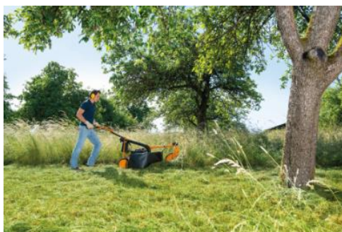
Illustration 2 : Les débroussailleuses de AS-Motor tondent la végétation atteignant une hauteur de 150 cm.