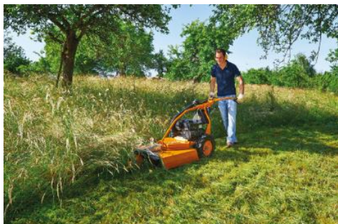
Illustration 1 : L'adaptation des procédures de tonte dans les zones marginales signifie une réduction des intervalles de tonte par an et le repoussement de la date de la première tonte.