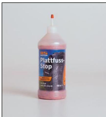
Illustration 2 : La bouteille de 950 ml de « Plattfuss-Stop » suffit pour le pneu arrière d'une tondeuse autoportée Sherpa

Illustration 1 : L'agent de protection contre les crevaisons d'AS-Motor scelle les crevaisons dans la zone de bande de roulement des pneus, souvent de manière inaperçue.