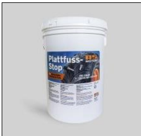
Illustration 3 : « Plattfuss-Stop » est également disponible en récipient de 20 litres ; il ne colle pas, ne s'agglutine pas et a une durée de vie illimitée